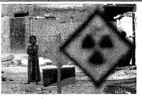
ตูเวท่า ในอิรัก เหยื่อสารกัมมันตรังสีจากการโจมตีของสหรัฐฯ

WWW. PapaCambridge.com ไปนั่งคุยกัน สนับสนุนซึ่งกันแล เพื่อให้บรรลูวัตถุประสงค์ เราเป็น องค์กรอิสระไม่ขึ้นกับรัฐบาล พรรค การเมืองและบริษัทใด ๆ ทั้งสิ้น งบประมาณของเราได้มาจากเงินบริจาค ของผู้สนับสนุนราวสองล้านแปดแสน คนทั่วโลก พวกเขาบริจาคให้เราเป็น รายเดือน มากบ้าง น้อยบ้าง และเราก็ นำเงินตรงนั้นไปใช้ในการรณรงค์ทั่ว โลก ในประเทศไทย เรามีผู้สนับสนุน ประมาณ 3,200 คน ซึ่งน้อยมากถ้า เทียบกับทรัพยากรที่เราต้องใช้ใน การรณรงค์ เพราะเครือข่ายที่เราทำ ครอบคลมทั้งเอเชียต่ะวันออกเฉียงใต้ เราจำเป็นต้องหาผู้สนับสนุนให้มาก ที่สุดเท่าที่จะทำได้"